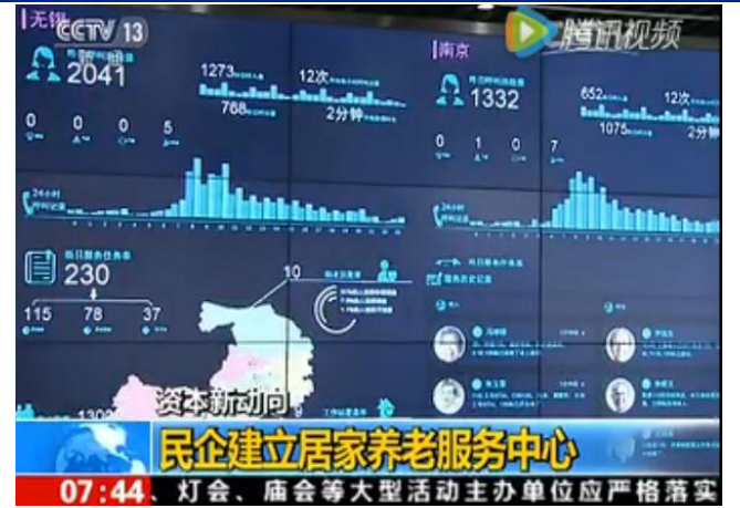
图 2：公司居家养老服务模式获央视认可