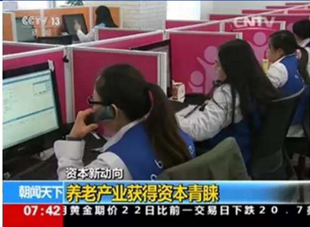
图 1：央视《朝闻天下》关注养老产业布局